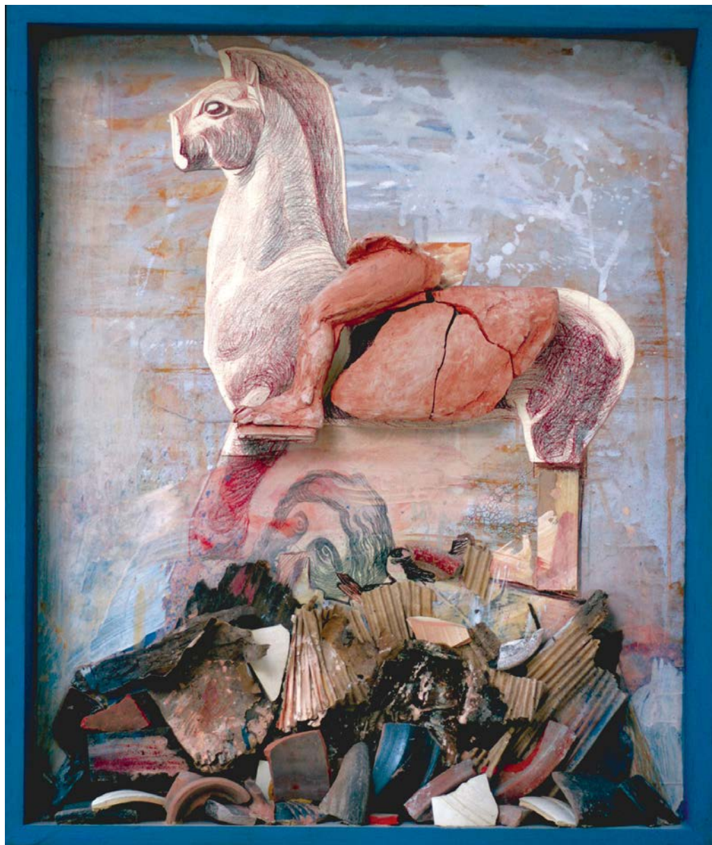
Ливну Епурас, Румунија Из циклуса „Археологија“ Узданица , децембар 2014, год. XI, бр. 2